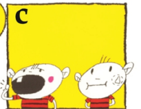
দুধ অথবা স্যালাইন জল না থাকলে দাঁতটিকে মাড়ি আর গালের মধ্যে মুখের লালারসে রাখুন