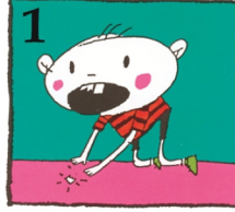
ভাঙ্গা দাঁতের অংশটি খুঁজে নিন