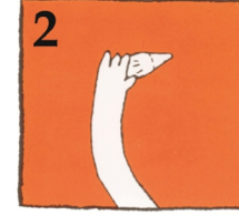
দাঁতটিকে আবশ্যই তার মাড়ির বাহিরের অংশে ধরবেন (দাঁতের গোঁড়া কে ছোঁয়া যথা সম্ভব বাঁচিয়ে)