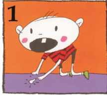
উৎপাচিত দাঁতটি খুঁজে নিন