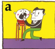
দাঁতটি মাড়ির মধ্যে প্রতিস্থাপন করুন

4 নিম্ন বিকল্প গুলির মধ্যে যেটি সম্ভব সেটি পালন করুন