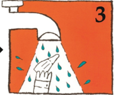
সাবধানে ঠাণ্ডা কলের জলে ধুয়ে নিন

4 নিম্ন বিকল্প গুলির মধ্যে যেটি সম্ভব সেটি পালন করুন