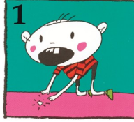
1 ଭଙ୍ଗା ଦାନ୍ତ ଖଣ୍ଡଟିକୁ ଖୋଜନ୍ତୁ