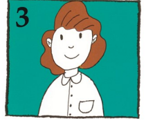
3 ଏହା କରାଇବାକୁ ତୁରନ୍ତ ଜଣେ ଦନ୍ତ ଚିକିତ୍ସକଙ୍କ ସହ ପରାମର୍ଶ କରନ୍ତୁ