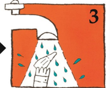
3 (ସିଲ୍ ବନ୍ଦ କରନ୍ତୁ) ଅଣ୍ଟା କଳ ପାଣିରେ ଧୋଇଦିଅନ୍ତୁ

4 ନିମ୍ନ ଲିଖିତ ବିକଳ୍ପ ଗୁଡ଼ିକ ମଧ୍ୟରୁ ଗୋଟିଏକୁ ଅନୁସରଣ କରନ୍ତୁ