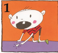
1 ଭାଙ୍ଗିଯାଇଥିବା ଦାନ୍ତଟିକୁ ଖୋଜନ୍ତୁ