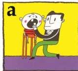
a ଦାନ୍ତକୁ ଏହାର ଯାଗାରେ ପୁଣି ଖଞ୍ଜିଦିଅନ୍ତୁ

4 ନିମ୍ନ ଲିଖିତ ବିକଳ୍ପ ଗୁଡ଼ିକ ମଧ୍ୟରୁ ଗୋଟିଏକୁ ଅନୁସରଣ କରନ୍ତୁ