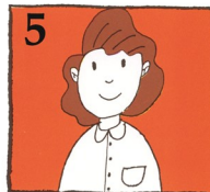
5 ତୁରନ୍ତ ଦୁଇ ଘଣ୍ଟାର ସମୟ ମଧ୍ୟରେ କୌଣସି ବିଶେଷଜ୍ଞ ଦନ୍ତ ଚିକିତ୍ସକଙ୍କ ଦ୍ଵାରା ଚିକିତ୍ସା କରନ୍ତୁ