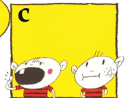
c ଶ୍ଵାର ଉପଲବ୍ଧ ହୋଇନଥିଲେ, ଦାନ୍ତକୁ ପାଟି ଭିତରେ ଗାଲ ଓ ମାଢ଼ି ମଝିରେ ରଖିଦିଅନ୍ତୁ