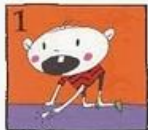
Cari gigi tersebut