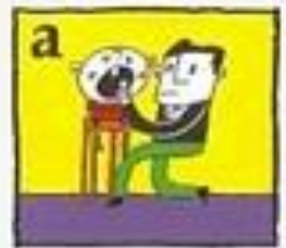
letak gigi tersebut kembali di tempatnya