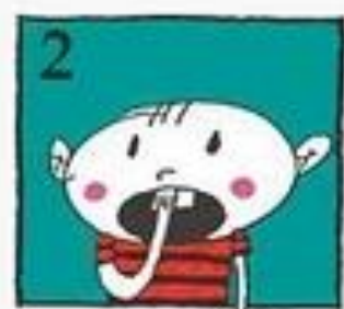
Serpihan gigi tersebut boleh dilekatkan