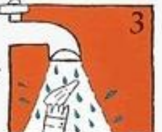
Basuh di bawah paip yang mengalir