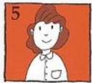
Segera dapatkan rawatan dari doktor gigi, sebelum 2 jam yang pertama