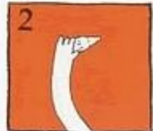
Pegang di bahagian korona