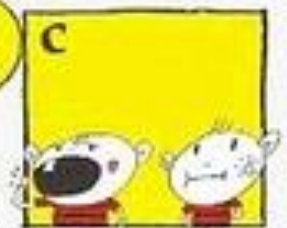
Jika tiada susu, letakkan gigi di dalam mulut diantara pipi dan gusi