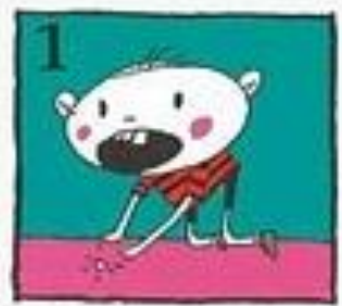
Cari serpihan gigi