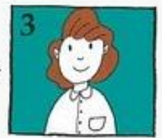
Untuk itu, segeralah berjumpa dengan doktor gigi