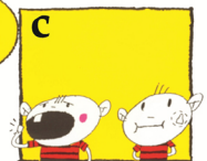
c Lägg tanden i munnen mellan kinden och tandkötet