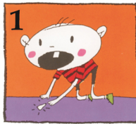
1 Hitta tanden