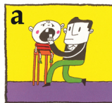
a Sätt tillbaka tanden på sin plats