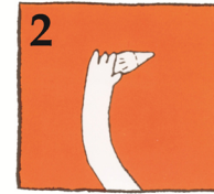
2 Håll den i kronan