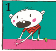
1 Hitta tandbiten