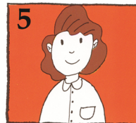
5 Sök omedelbart hjälp hos din tandläkare