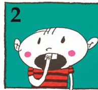
2 Biten kan limmas tillbaka