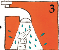
3 (Täpp för avloppet) Skölj i kallt kranvatten