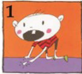
1 పంటిని వెతికి పట్టుకోండి