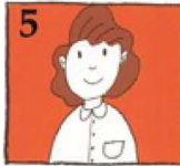
5 రెండు గంటల వ్యవధిలోపు ప్రత్యేక దంత చికిత్సను తీసుకోండి