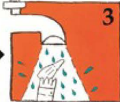
3 తగిన జాగ్రత్తతో చల్లని పంపు నీటిలో శుభ్రం చేయండి