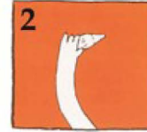
2 దాని కిరీట భాగాన్ని పట్టుకోండి