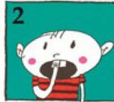
2 ఆ విరిగిన ముక్కను తిరిగి అతికించవచ్చు