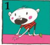
1 విరిగిన పంటిభాగాన్ని వెతకండి